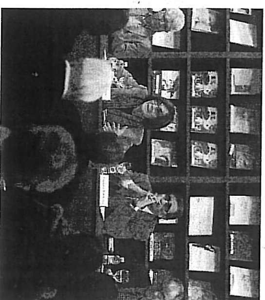
Vinyes, Lamarc, Fonbona i Cruanyes, ahir. / JUANMA RAMOS